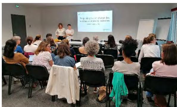
Soirée d'information auprès des gynécologues – Juin 2024

L'équipe de la Maison des femmes a également communiqué auprès des professionnels de santé libéraux (médecins, sage-femmes, infirmiers, kinésithérapeutes, pharmaciens, dentistes...) pour leur indiquer les modalités de saisine pour un conseil ou orienter leur patiente avec son accord.