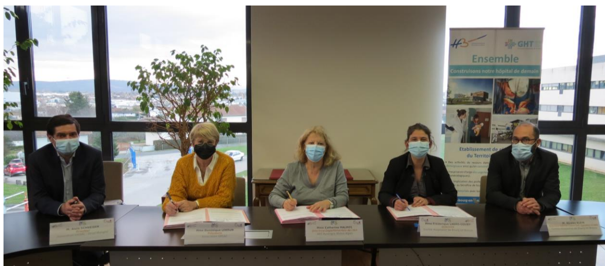
06 janvier 2022 : Signature de l'avenant de l'accord cadre pour la construction d'un ensemble SSR unique sur le site de Fleyriat pour le Centre hospitalier de Bourg-en-Bresse et l'Association ORSAC

Différents principes ont également permis le succès du projet immobilier comme la rédaction d'un Projet Médical partagé, l'individualisation des unités d'hospitalisation, la recherche de solutions pour optimiser les coûts de construction, la recherche commune d'une organisation efficiente des activités du Plateau de Rééducation et des engagements communs pour améliorer la qualité des soins et les services aux patients.