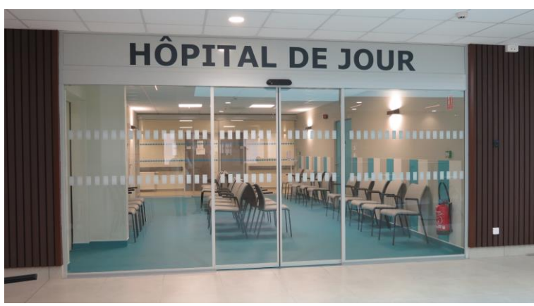
Une signalétique lisible.