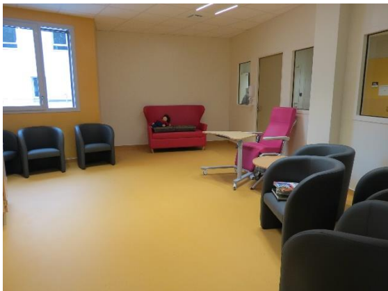
Salle de détente des résidents dans l'Unité cognitivo-comportementale

Ainsi, le nouveau Pôle de Rééducation / Réadaptation, regroupe l'ensemble des unités d'hospitalisation (136 lits) et un hôpital de jour (43 places), les locaux techniques et médico-techniques avec un plateau de rééducation de plus de 1300 mètres carrés.