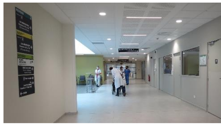
L'entrée du bâtiment est lumineuse et spacieuse.