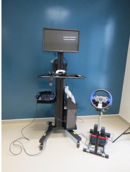
Une salle de réalité virtuelle