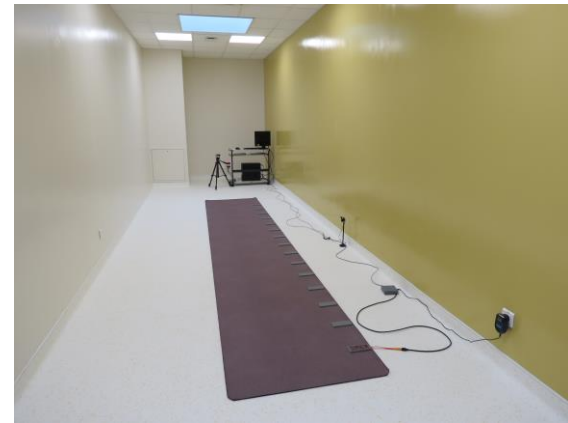
Plateau technique moderne et équipé.