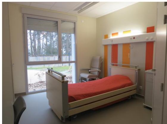
Une chambre de l'Unité cognitivo-comportementale