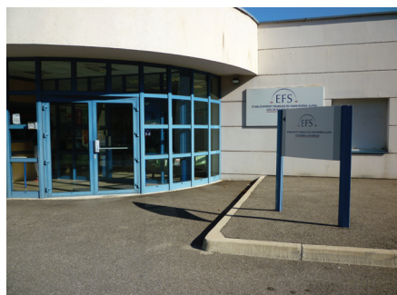
Établissement Français du Sang (E.F.S)

Si votre traitement consiste en l'administration de produits sanguins (globules rouges, plaquettes) c'est l'Établissement Français du Sang qui délivre les produits nécessaires et l'infirmier du service qui vous les administre.