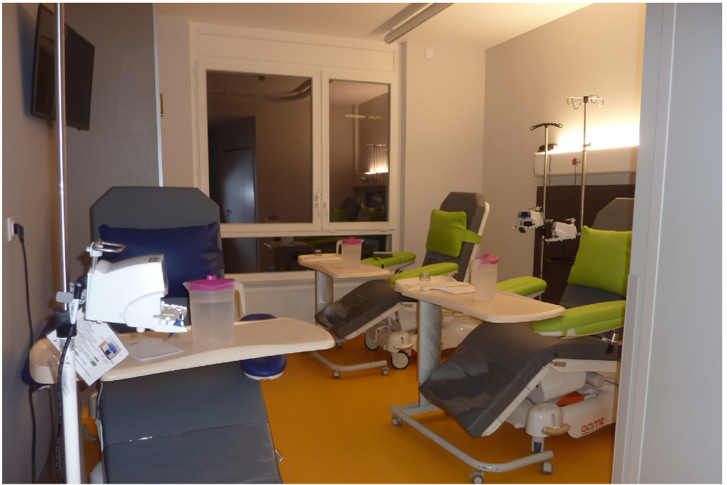
Salles de soins du service de cancérologie