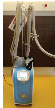
Le PAXMAN (casque à 4°)