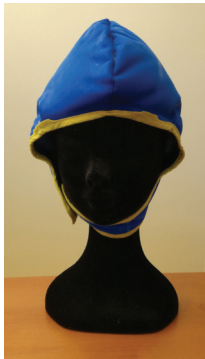
Le port d'un casque réfrigérant (bonnet glacé)

Il existe deux possibilités pour réduire la chute des cheveux :