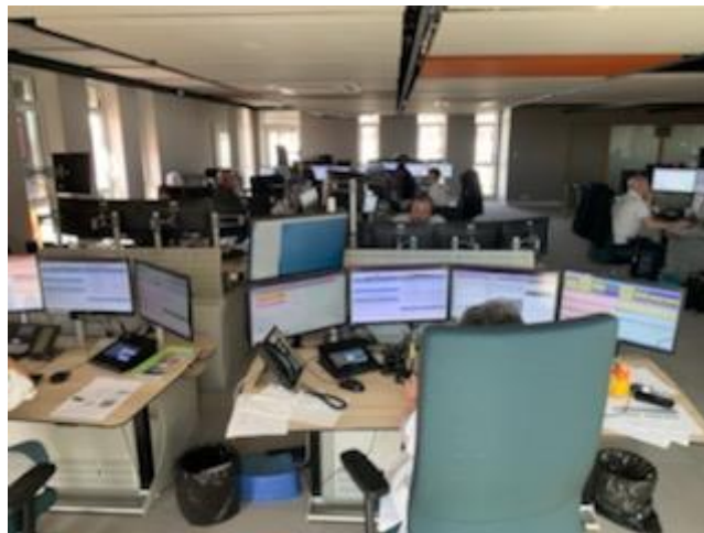
Salle de régulation commune 15-18

Ces organisations ont pu être mises en place grâce à une mobilisation exemplaire des médecins urgentistes et des ARM, ainsi que des internes affectés au service d'accueil des urgences et d'infirmier.e.s retraité.e.s volontaires.