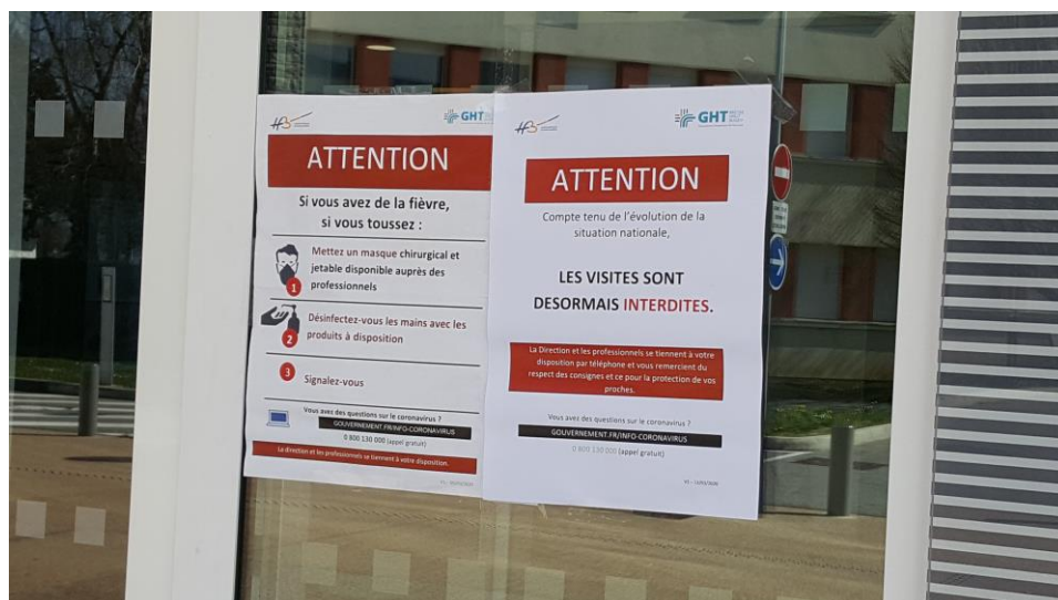
Un affichage est réalisé sur les trois sites du Centre hospitalier.

Des autorisations de visite exceptionnelles peuvent être délivrées sur accord médical.