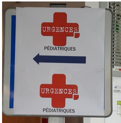
Le circuit pédiatrique fait l'objet d'un fléchage spécifique et d'un marquage au sol.

L'activité du service d'accueil des urgences est restée globalement stable, mais les équipes sont préparées à l'arrivée d'un afflux massif de patients. Le tableau ci-dessous illustre l'activité des derniers jours dans les différentes filières de soins, en nombre de passages.